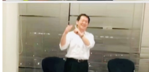
講師はデフ(ろう者)